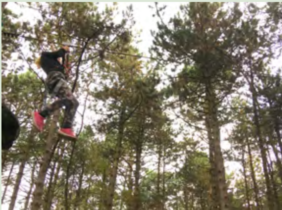
Armoedebeleid Gemeente Tynaarlo: Klimmen in het park

Jongeren die een aanvraag hebben gedaan bij Jeugd Sportfonds of Jeugd Cultuurfonds kregen een uitnodiging om mee te gaan klimmen in een klimpark. Tijdens de dag werden ze gevraagd wat de gemeente anders kon doen op het gebied van armoedebeleid. Uiteraard werd dit vooraf verteld dat dit het doel was van de activiteit (naast een leuk dagje weg). Je moet altijd open en eerlijk communiceren over je doelen!