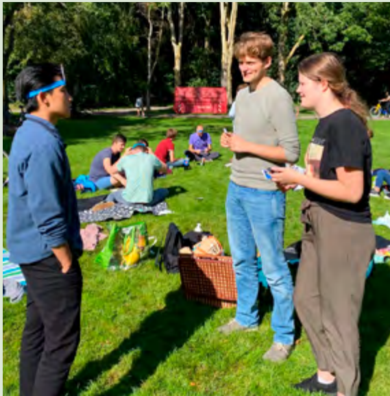
Spelletjesmiddag in park met jongerengroep

Een relatie opbouwen kost tijd en werkt het beste als je naast de inhoudelijke activiteiten, ook niet-inhoudelijke activiteiten organiseert waar de jongeren elkaar op een informele manier leren kennen. Maar niet alleen de jongeren leren elkaar kennen, ze leren jou kennen en jij leert hen beter kennen. Dit is heel waardevol voor de rest van het project. Denk bijvoorbeeld aan een barbecue (eten verbindt tenslotte altijd), of een spelletjesavond.