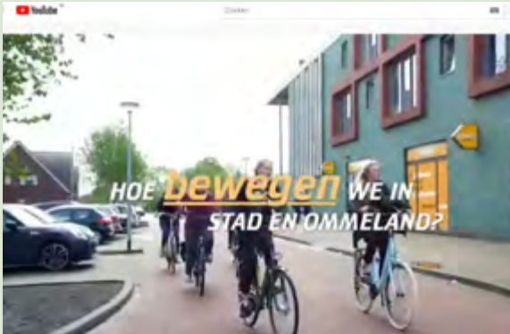
YouTube: sfeerfilm Expeditie Mobiliteit

Als onderdeel van een groter jongerenparticipatie-traject gaan jongeren op expeditie en leveren met opdrachten input voor het nieuwe mobiliteitsbeleid van de Provincie Groningen. Deze expeditie is tijdens schooltijd georganiseerd, met een link naar lesinhoud.