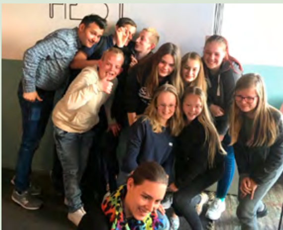
JongerenTop: vloggen RTV Noord

Jongeren die een aanvraag hebben gedaan bij Jeugd Sportfonds of Jeugd Cultuurfonds kregen een uitnodiging om mee te gaan klimmen in een klimpark. Tijdens de dag werden ze gevraagd wat de gemeente anders kon doen op het gebied van armoedebeleid. Uiteraard werd dit vooraf verteld dat dit het doel was van de activiteit (naast een leuk dagje weg). Je moet altijd open en eerlijk communiceren over je doelen!