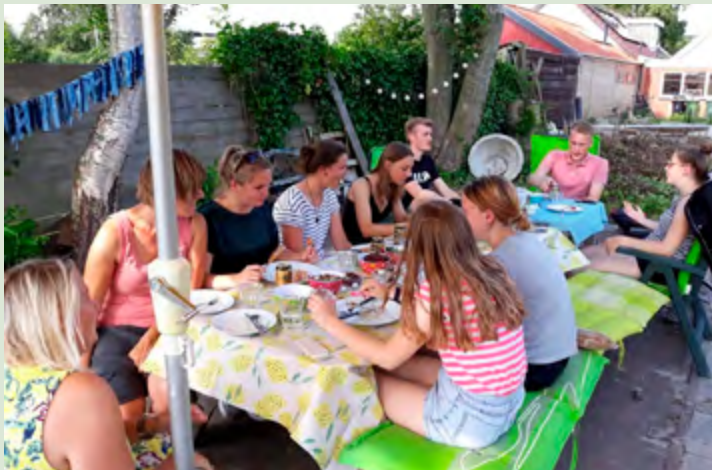
Barbecue met spiegelgroep van JongerenTop

Een relatie opbouwen kost tijd en werkt het beste als je naast de inhoudelijke activiteiten, ook niet-inhoudelijke activiteiten organiseert waar de jongeren elkaar op een informele manier leren kennen. Maar niet alleen de jongeren leren elkaar kennen, ze leren jou kennen en jij leert hen beter kennen. Dit is heel waardevol voor de rest van het project. Denk bijvoorbeeld aan een barbecue (eten verbindt tenslotte altijd), of een spelletjesavond.